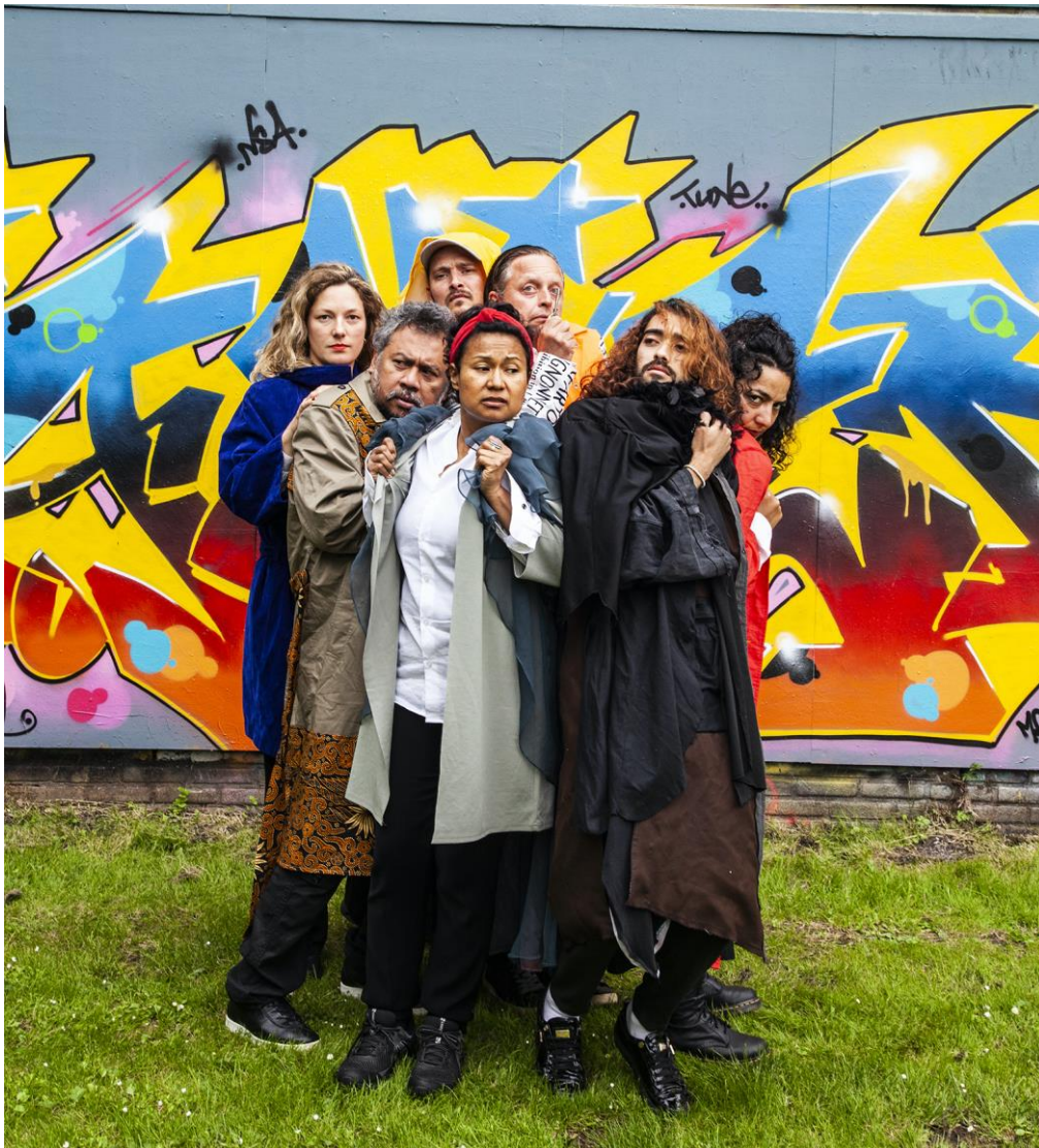
Persfoto voor ExploreZ Festival 2021