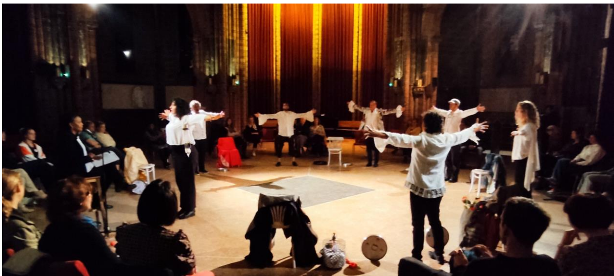
Het Alfabet van Onzekere Tijden in het Vondelkerk in Amsterdam tijdens ExploreZ Festival 2021