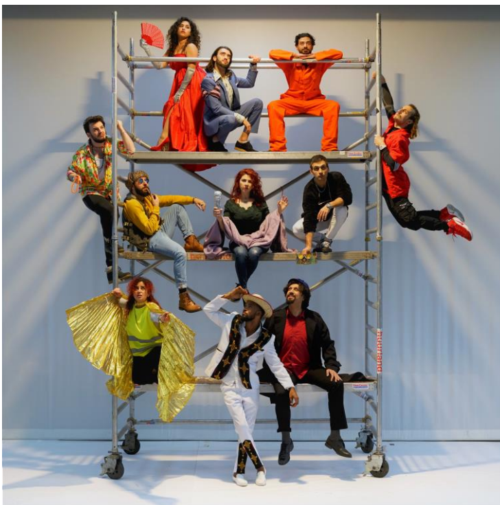
De spelers van NO FEAR!

Future Academy on Tour in Europe is een Europees project, dat performers uit verschillende landen verbindt met de culturele sector van Nederland en Europa. Door middel van training en het maken van een voorstelling probeert ZID Theater een brug te vormen tussen het talent van deze performers en de culturele sector.